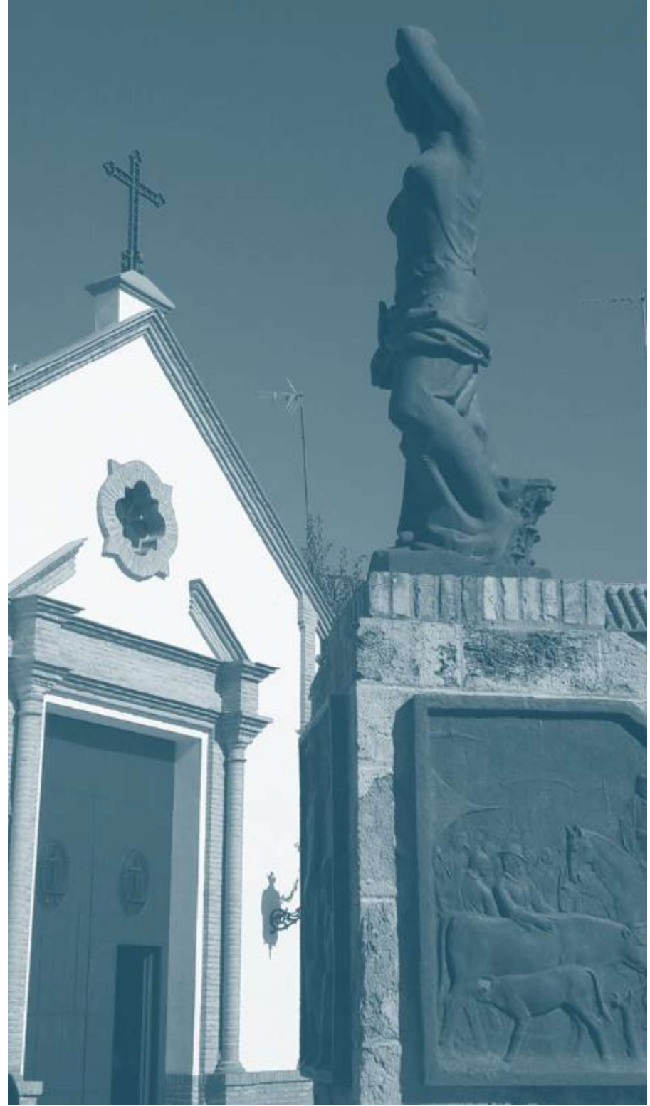
Capilla Cristo de la Cárcel